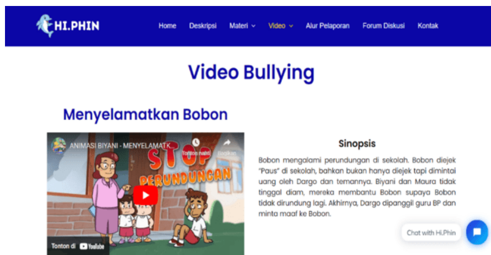
Gambar 4. Halaman Video

Halaman video menyajikan tiga video edukatif yang dirancang khusus untuk meningkatkan pemahaman peserta didik mengenai bullying dan kekerasan seksual di lingkungan sekolah. Video-video ini disajikan secara menarik dan interaktif. Selain itu terdapat sinopsis singkat tentang video yang ditampilkan.