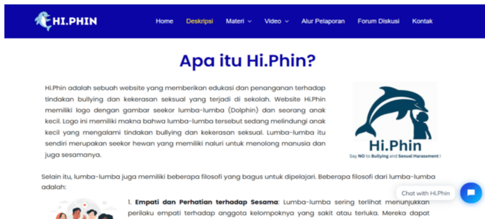
Gambar 2. Halaman Deskripsi

Halaman deskripsi ini menyajikan informasi lengkap mengenai identitas website Hi.Phin, mulai dari pengertian, makna logo, hingga tujuan pembuatan website Hi.Phin. Pada halaman deskripsi, peserta didik akan memahami filosofi yang mendasari keberadaan website Hi.Phin.