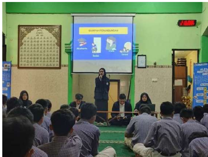
Gambar 8. Sosialisasi Website Hi.Phin

Setelah mengikuti sosialisasi, peserta didik kelas VII SMP Negeri 8 Malang diberikan kesempatan untuk berdiskusi secara interaktif mengenai materi yang telah disampaikan, termasuk penggunaan website Hi.Phin. Diskusi yang dilakukan dalam bentuk dialog ini bertujuan untuk menggali pemahaman peserta didik tentang bullying dan kekerasan seksual serta cara memanfaatkan fitur-fitur yang tersedia di website Hi.Phin. Diakhir sesi peserta didik mengisi kuesioner tentang pengalamannya menggunakan website Hi.Phin.