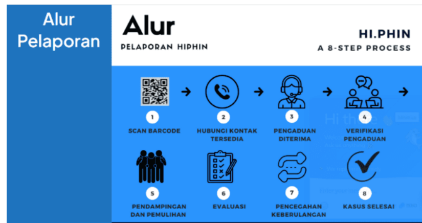
Gambar 5. Halaman Alur Pelaporan