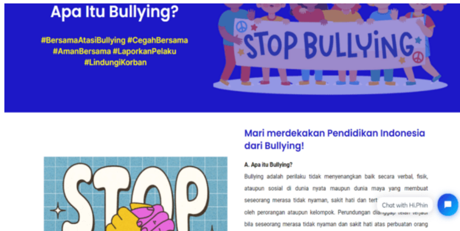
Gambar 3. Halaman Materi