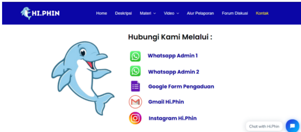
Gambar 7. Halaman Kontak