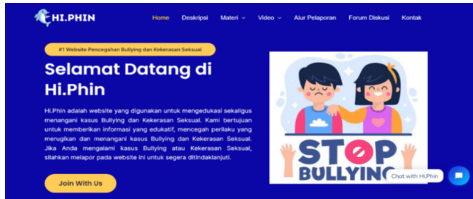
Gambar 1. Halaman Home