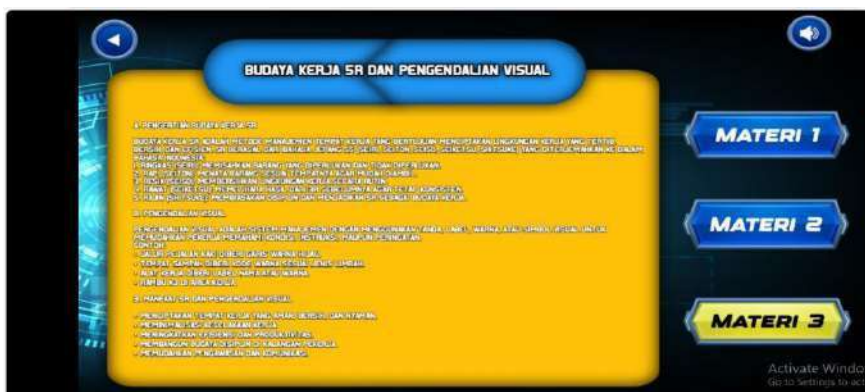
Gambar 6. Desain Halaman materi Budaya Kerja 5R dan Pengendalian Visual

c. Halaman materi Budaya Kerja 5R dan Pengendalian Visual berisi penjelasan materi yang harus dipelajari peserta didik.