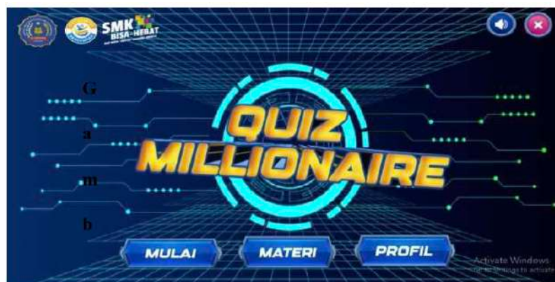
Gambar 1. Desain Halaman Menu Utama

Halaman menu utama membuat menu yang terdapat pada media pembelajaran dan beberapa tombol navigasi. Adapun menu utama terdiri dari menu mulai, menu materi, dan menu profil. Tombol navigasi yang ada di halaman menu utama diantaranya tombol mulai, tombol materi, tombol profil, tombol sound on/sound off , dan tombol exit .