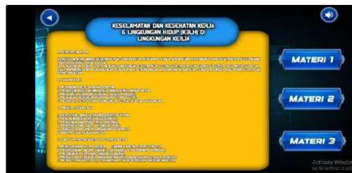
Gambar 4. Desain Halaman materi K3LH di Lingkungan Kerja