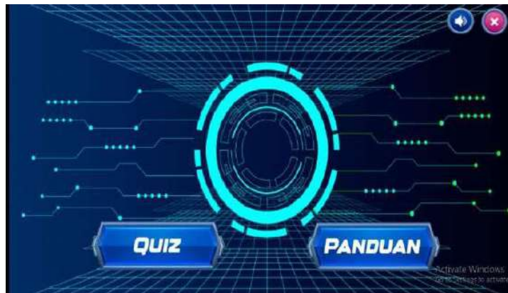
Gambar 2. Desain Halaman Menu Mulai