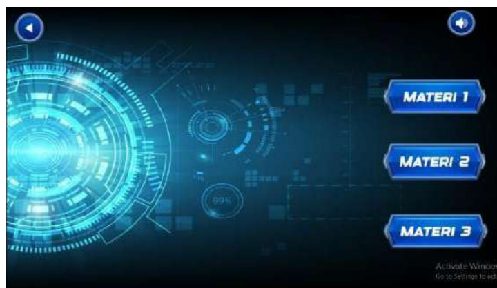
Gambar 3. Desain Halaman Menu Materi

Halaman menu materi merupakan halaman yang berisi pilihan materi untuk dipelajari. Menu materi terdiri dari pilihan materi K3LH dan Budaya Kerja Industri. Masing-masing materi terdiri dari materi K3LH di Lingkungan Kerja, materi Pencegahan Kecelakaan Kerja, dan materi Budaya Kerja 5R dan Pengendalian Visual.