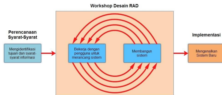
Gambar 1. Desain RAD

Dalam pengembangan sistem informasi normal, memerlukan waktu minimal 180 hari, namun dengan menggunakan metode RAD, sistem dapat diselesaikan dalam waktu 30-90 hari. Selain itu metode RAD melibatkan pengguna dalam proses pengembangan sehingga kebutuhan sistem dapat terpenuhi dengan baik dan sesuai dengan keinginan pengguna itu sendiri [7]. Terdapat 3 tahapan dari metode RAD seperti pada Gambar 1: