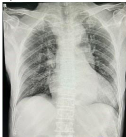
Gambar 1. Hasil Foto Thoraks Tn. C

Pada pemeriksaan penunjang dilakukan pemeriksaan laboratorium didapatkan Hb 11,3 g/dL, Hematokrit 36%, Eritrosit 3,95 10 6 /μL, MCHC 32 g/dL, Leukosit 5.900/mikroL, Neutrofil 74%, Limfosit 18%, LED 30 mm/jam, ureum 45 mg/dL, kreatinin 1,5 mg/dL dan eGFR 49,5 mL/min/1,73 m 2 . Pemeriksaan penunjang lainnya, dilakukan pemeriksaan foto thoraks (Gambar 1) dengan kesan cardiomegali (CTR >50%) dan elongatio aorta.