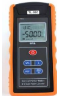
Gambar 1. Optical Power Meter

gelombang cahaya yang diukur. Power meter optik bekerja dengan prinsip mengukur intensitas cahaya optik yang masuk ke dalam sensor photodiode. Sensor ini telah dikalibrasi untuk cakupan panjang gelombang yang spesifik (850nm 1550nm). Intensitas cahaya kemudian diubah menjadi sinyal listrik oleh rangkaian DC dan ditampilkan pada layar LCD. Akurasi pengukuran power meter optik sangat bergantung ada kalibrasi yang tepat. Proses kalibrasi ini perlu dilakukan secara berkala untuk memastikan sensor photodiode dalam kondisi optimal dan mampu menghasilkan pembacaan yang akurat [9].