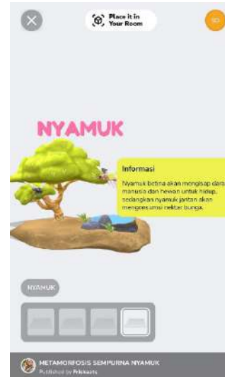
Gambar 6. Tampilan 3D dalam Smartphone