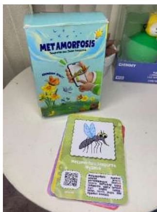
Gambar 2. Media Flashcard Augmented Reality

Tahap yang kedua yaitu desain media flashcard AR yang akan dikembangkan. Media dirancang menggunakan aplikasi Assemble edu dan Assemblr studio. Media AR dirancang secara 3D untuk menciptakan tampilan yang menarik siswa. Media divisualisasi secara interaktif dan menarik, seperti menampilkan model 3D dari konsep-konsep siklus hidup hewan agar siswa memahami materi dengan lebih visual dan dinamis.