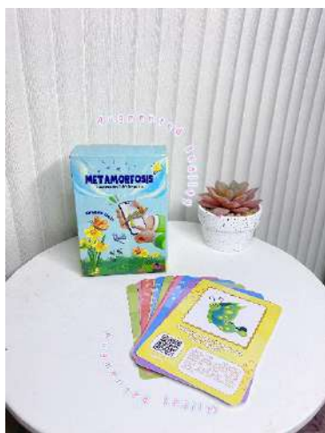
Gambar 3. Tampilan Flashcard Augmented Reality

Hasil yang didapatkan dari para validasi ahli rata-rata diperoleh tingkat kelayakan 88,5% ahli media, 74% ahli materi, dan 92% ahli bahasa. Maka dapat dikatakan bahwa media flashcard augmented reality “Sangat Layak” untuk diujicobakan dan diterapkan. Hasil penembangan media flashcad berbasis Augmented Reality setelah validasi oleh ahli media, ahli materi.