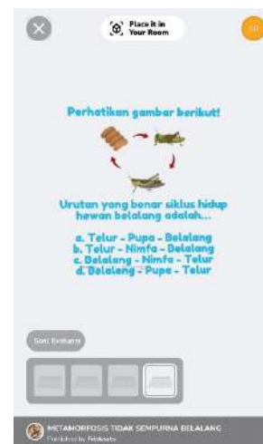
Gambar 5. Tampilan Soal Evaluasi