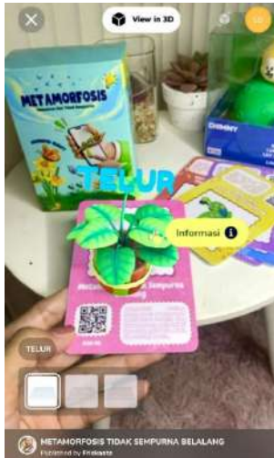
Gambar 2. Tampilan 3D Disekitar