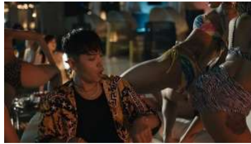
Gambar 3. Seorang laki-laki yang sedang memandangi bagian tubuh penari