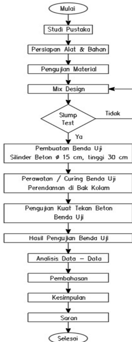
Gambar 1. Diagram Alur Penelitian