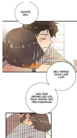
Gambar 2. Contoh panel kolom Sumber : Webtoon “Matahari ½ Lingkari” karya Chairunnisa