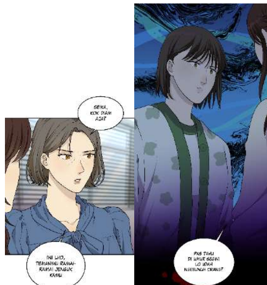
Gambar 8. Perbandingan ukuran panel adegan biasa dan adegan penting

Variasi ukuran panel dan juga dapat mempengaruhi suasana dan ekspresi dalam cerita. Penulis menggunakan ukuran panel medium untuk adegan biasa, sementara untuk adegan penting menggunakan panel full layar yang panjang. Semakin panjang panel yang digunakan, maka semakin lama juga pembaca akan menatap gambar tersebut. Hal ini dapat dimanfaatkan untuk mengatur perkiraan waktu membaca.