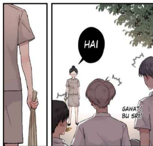
Gambar 1. Contoh panel baris Sumber : Webtoon "OTENBA" karya Dihocchi

Panel baris adalah panel atau gambar yang dibaca secara horizontal dari kiri ke kanan maupun sebaliknya [10].