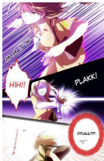
Gambar 3. Contoh layout diagonal Sumber : Webtoon “My Pre-Wedding” karya Annisa Nisfihani

Layout diagonal terdiri dari panel berbentuk miring yang menciptakan kesan lebih mendalam dan konfliknya lebih terasa [10].