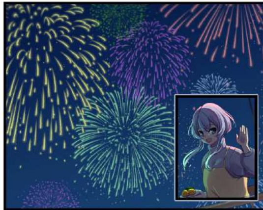
Gambar 4. Contoh layout inset