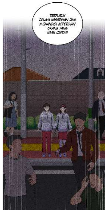
Gambar 7. Contoh komponen penting gambar dan teks yang difokuskan di tengah