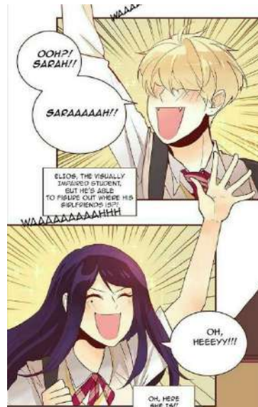
Gambar 6. Contoh broken frame