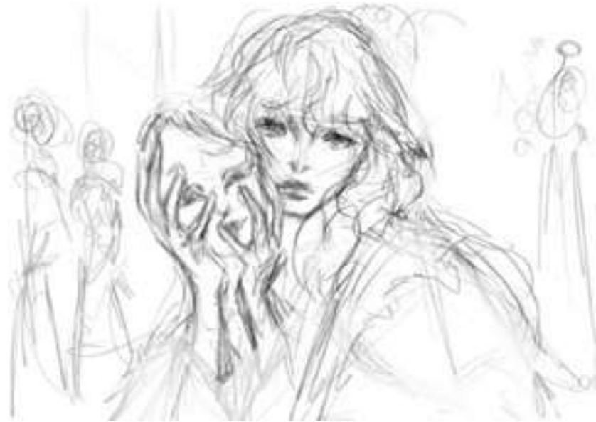
Gambar 2. Sketsa Perancangan Ilustrasi

Sumber foto : Rain Natasha Pratama. Tahun 2025