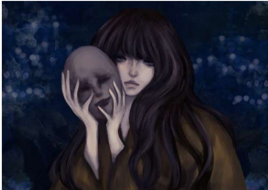
Gambar 3. Hasil Ilustrasi Interpretasi Puisi