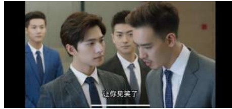
Gambar 21 让你见笑了