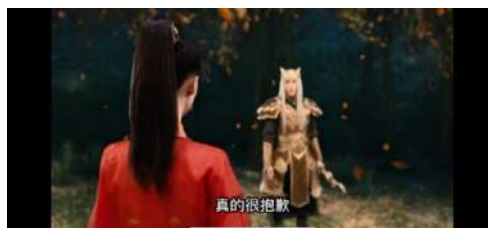
Gambar 4 抱歉