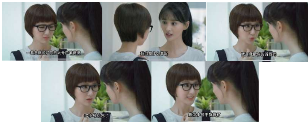
Gambar 13 一着急

Hanzi: “就是我把你告诉我的ID小号给忘了。一着急就说了你的大号芦苇微微”、“我当时什么事呢。我说小号不就得了”