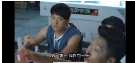
Gambar 17 自罚