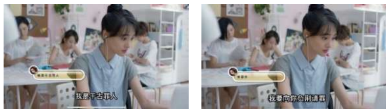
Gambar 16 罪人