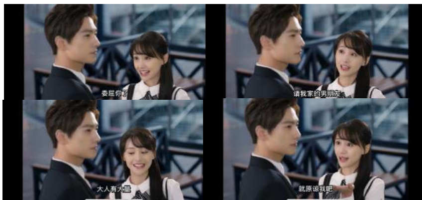
Gambar 9 原谅