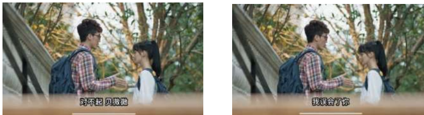
Gambar 6 对不起