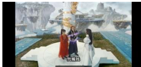
Gambar 11 嘴贱