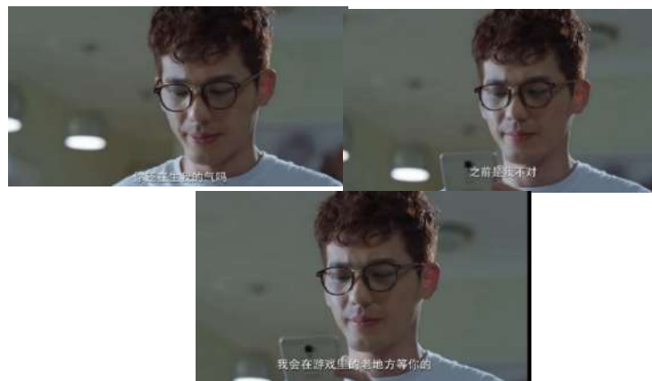
Gambar 20 我不对