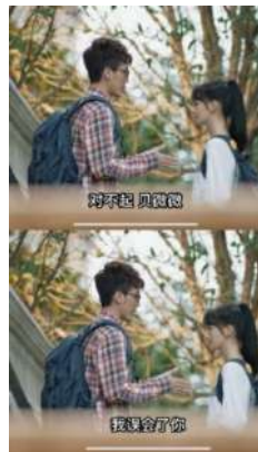
Gambar 1 Permintaan maaf “对不起” (2016, Love O2O)

Objek penelitian ini adalah serial drama Tiongkok berjudul Love O2O (2016), bergenre komedi-romantis dengan 30 episode. Drama ini dibintangi Zheng Shuang sebagai Bei Weiwei dan Yang Yang sebagai Xiao Nai. Ceritanya berkisah tentang Bei Weiwei, mahasiswi pintar dan gamer berbakat, yang menarik perhatian Xiao Nai, pria jenius dan populer di kampusnya. Interaksi mereka berawal di dunia game online, lalu berkembang ke kehidupan nyata. Serial ini mengisahkan perjalanan cinta mereka yang manis, penuh tantangan, serta dipadukan dengan unsur teknologi dan persahabatan.