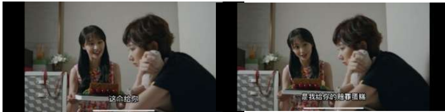
Gambar 8 赔罪