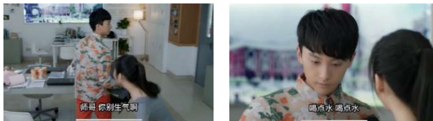
Gambar 12 别生