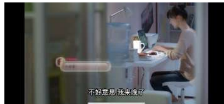
Gambar 5 不好意思