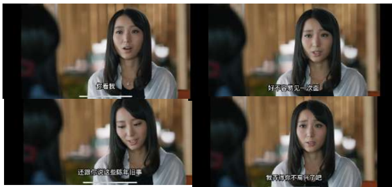
Gambar 18 弄得你不高兴

Hanzi: "你看我 好不容易见一次面还跟你说这些陈年旧事。 我弄得你不高兴了吧"