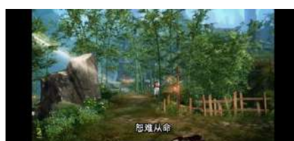
Gambar 7 怨