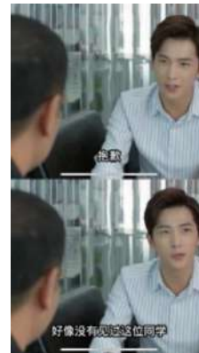
Gambar 2 Permintaan maaf “抱歉” (2016, Love O2O)

Berdasarkan analisis tindak tutur terhadap dua kalimat dalam Love O2O Episode 3, yaitu “对不起 贝微微、我误会了你” dan “抱歉、好像没有见过这位同学”. Kata “对不起” duibuqi memiliki ilokusi permintaan maaf yang bersifat ekspresif untuk Cao Guang menyatakan penyesalan dan mengakui kesalahannya dan merupakan permintaan maaf langsung karena Cao Guang langsung menyatakan penyesalannya dan meminta maaf langsung di hadapan Bei Weiwei. Kata “抱歉” baòqiàn memiliki ilokusi dengan tujuan menyangkal pengenalan dengan sopan sekaligus menghindari pengakuan jujur karena alasan tertentu, dan merupakan permintaan maaf langsung karena Xiao Nai menyampaikan permintaan maaf tersebut secara langsung.