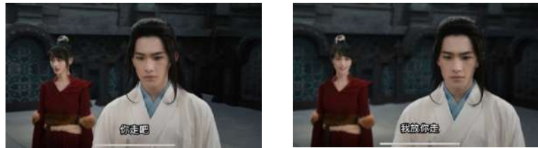
Gambar 14 放你走