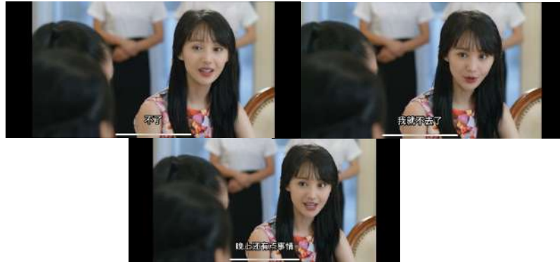
Gambar 19 不了(bùliǎo)