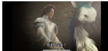
Gambar 15 久等