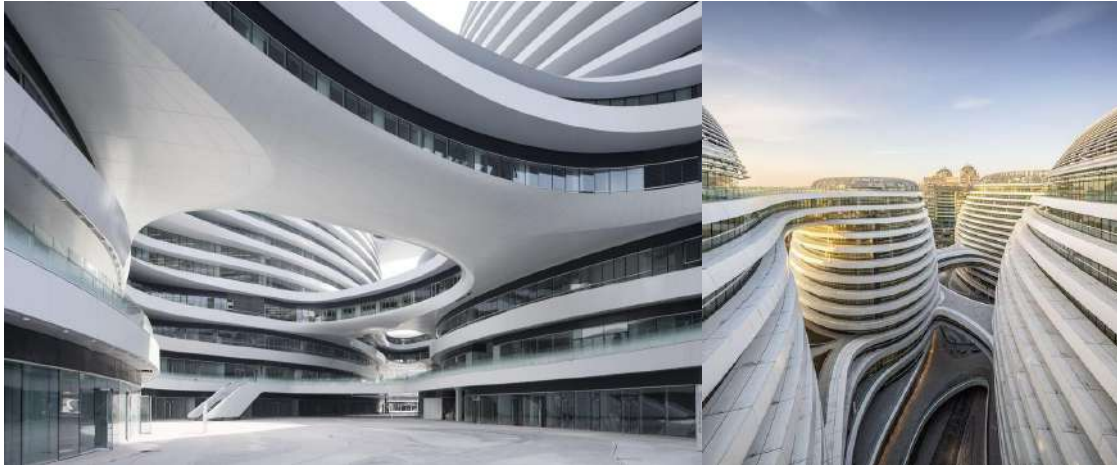
Gambar 1. Bentuk dan Gubahan Massa