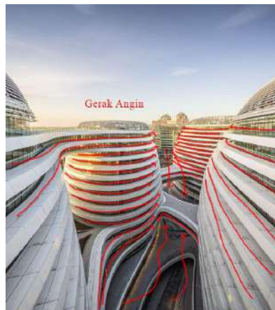
Gambar 5. Pembahasan Konsep Mixed Use dan Arsitektur Gerak

Konsep arsitektur gerak pada bangunan Galaxy Soho adalah salah satu elemen utama dalam desain karya Zaha Hadid Architects, yang berfokus pada fluiditas dan dinamika ruang. Konsep ini mencerminkan bagaimana bentuk, ruang, dan pengalaman pengguna menciptakan kesan pergerakan yang berkesinambungan, baik secara visual maupun fisik.