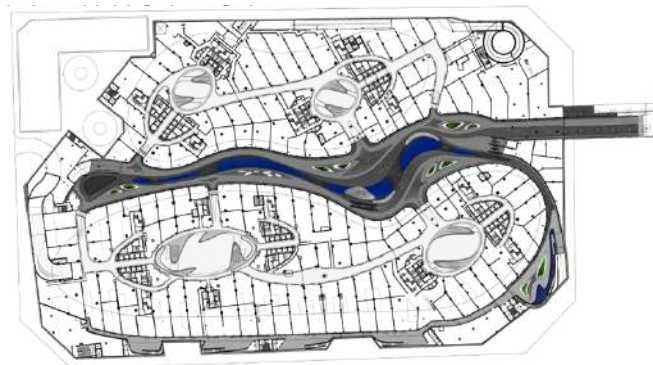
Gambar 2. Gambar Denah

Pada bangunan Galaxy Soho menerapkan konsep organik dan mengalir, Denah bangunan mengikuti konsep desain organik, dengan bentuk oval yang saling terhubung melalui koridor, ramp, dan jembatan lengkung. Denah tidak memiliki sudut tajam, menciptakan alur yang halus antar-ruang.