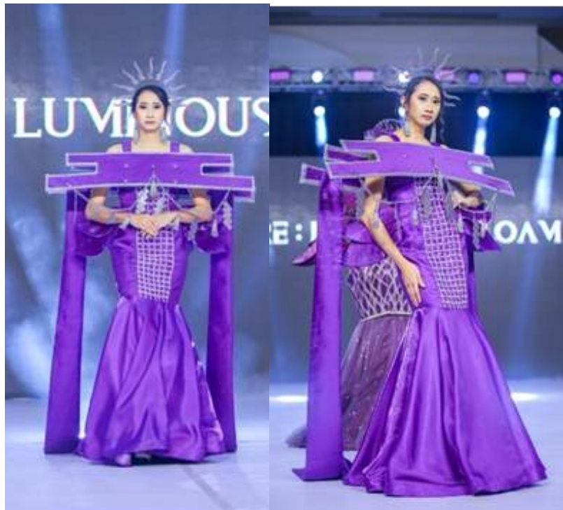
Gambar 7. Hasil jadi busana avant garde

Hasil jadi penciptaan busana avant garde inspirasi kuil shinto dengan teknik surface cording dan tassel memperoleh jawaban sangat baik. Desain busana menunjukkan kesesuaian dengan inspirasi kuil shinto dan kebaruan dalam desain busana avant garde . Teknik tassel diterapkan secara tepat, rapi, dan selaras dengan konsep perancangan busana. Roncean payet dinilai dapat mendukung tampilan busana yang mewah. Pemilihan bahan, serta tata letak surface cording dinilai sesuai dan mampu mendukung tampilan visual karakter desain busana. Bahan Mikado Liquid yang digunakan untuk busana dinilai cukup sesuai dan mendukung fungsi busana dari segi daya pakai, namun bahannya yang terlalu polos kurang mencerminkan eksplorasi material avant garde secara maksimal.