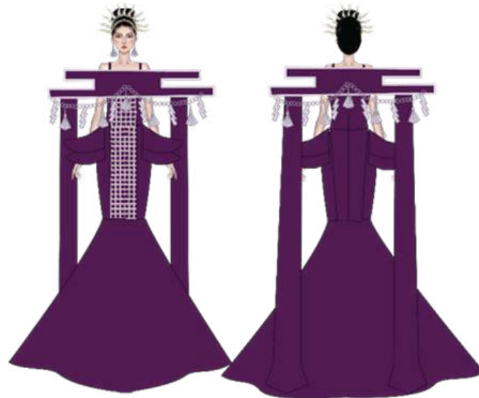
Gambar 2. Desain ilustrasi