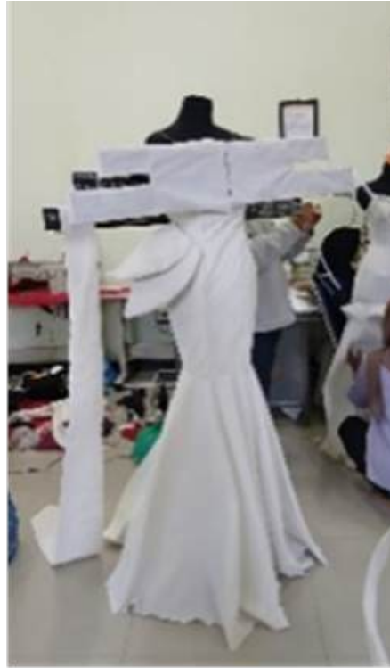
Gambar 5. Uji coba toal