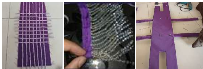
Gambar 6. Proses penciptaan busana avant garde

Proses penciptaan busana avant garde inspirasi kuil shinto dengan teknik surface cording dan tassel diawali dengan menentukan tema dan inspirasi, mendesain busana menggunakan software Adobe Illustrator CS6 . Uji coba pembuatan busana, perwujudan busana hingga tahap evaluasi oleh praktisi. Pada penelitian ini teknik surface cording dikerjakan terlebih dahulu pada potongan kain sebelum dijahit menjadi busana. Penerapan teknik surface cording diawali dengan membuat tali cordova dari kain yang dipotong serong. Selanjutnya menata tali cordova diatas permukaan kain lalu disemat menggunakan jarum pentul, kemudian dijahit dengan teknik selusup. Pembuatan tassel diawali dengan membuat roncean payet pada kain list dengan panjang 15 cm dan terdiri dari 25 helai roncean, setelah itu roncean payet digulung dan dimasukkan kedalam kepala tassel dengan diolesi lem.