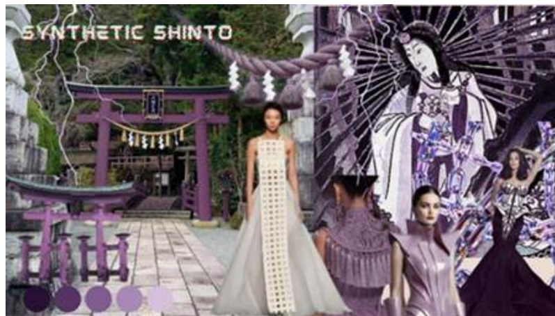
Gambar 1. Moodboard

Define merupakan proses penetapan inspirasi yang telah diperoleh dari hasil pengelompokan data pada tahap sebelumnya serta pengembangannya menjadi dasar perancangan. Pada tahap ini, peneliti menetapkan prioritas dari hasil eksplorasi inspirasi yang dianggap paling utama serta menentukan urutan penanganan yang tepat. Elemen kuil shinto yang diambil yaitu torii sebagai representasi dari transisi batas spiritual, dan awal kesucian, shimenawa sebagai representasi dari perlindungan, kesakralan, dan penjagaan energi murni, dan shide sebagai representasi dari nilai pembersihan, kehadiran roh, dan koneksi langit-bumi. Teknik surface cording akan digunakan untuk merepresentasikan torii . Bentuk shimenawa yang terdapat pada kuil shinto akan diterapkan menggunakan teknik tassel , dan bentuk shide akan diterapkan menggunakan bahan busa eva.