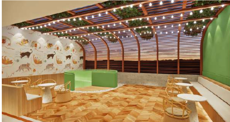
Gambar 4. Kafe Kucing Lt 2

ceiling dan karena ruangan semi outdoor maka mendapat sirkulasi udara dari luar sehingga ruangan tidak pengap.