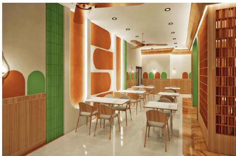
Gambar 3. Kafe Kucing

Di kafe kucing ini memiliki konsep semi outdoor karena adanya courtyard yang bertujuan agar kucing dapat menjemur dirinya di courtyard, agar kucing tidak kepanasan maka adanya water fountain untuk kucing minum. Pada wall panel cat cafe ini dihias dengan elemen lekungan seperti logo haus of miaw bewarna orange dan hijau, adanya wall panel berbentuk lurus warna hijau untuk pemanis ruangan. Material lantai yang digunakan dipertimbangkan agar mudah dibersihkan dan tidak menyimpan banyak bakteri, sehingga penggunaan lantai yang memiliki nat tidak digunakan [12]. Pada penggunaan material lantai disini menggunakan perpaduan antara keramik dan kayu agar kucing tidak licin saat berjalan di ruangan ini.