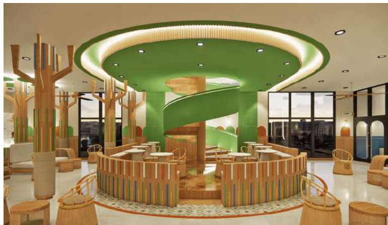
Gambar 1. Kafe Kucing Umum

Di kafe kucing, pelanggan yang tidak memiliki waktu atau ruang untuk merawat hewan peliharaan dapat merasakan waktu bermain dengan kucing tanpa tanggung jawab atau kerumitan kepemilikan [10]. Dalam era kafe, kafe kucing akan lebih menarik perhatian dengan konsep yang bertema. Atraktif dengan permainan warna yang menjadi modal utama dalam menciptakan daya tarik bangunan [11].