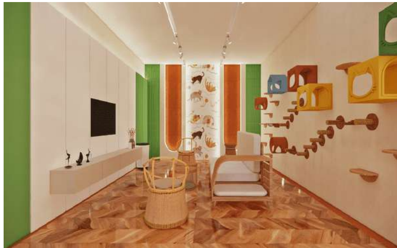
Gambar 6. Kafe KucingVIP