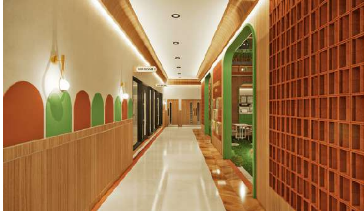
Gambar 2. Hallway Kafe Kucing

wonderland, terdapat area tangga lingkaran untuk akses ke cat cafe lantai 2 dan di desain bewarna hijau dan material kayu seperti pohon. Terdapat up ceiling yang berbentuk seperti logo haus of miaw dengan warna hijau. Kolom didesain seperti pohon dengan material kayu dan di dekorasi panel warna warni, adanya material feline sisal ( cat scratching material ).