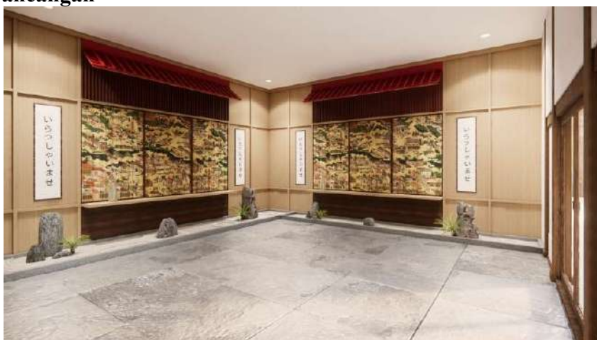
Gambar 8. Lobby Restoran Kikugawa