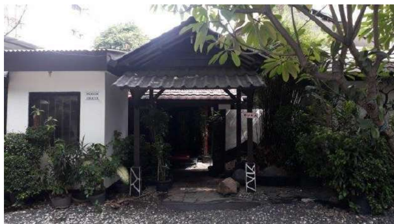
Gambar 2. Fasad Restoran Kikugawa

Sama halnya dengan umur dari restoran ini yang telah berdiri selama 54 tahun, terlihat fasad dari restoran ini terus mempertahankan kesan kuno yang dibawakan sebagai identitas restoran.