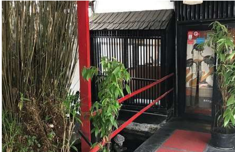
Gambar 3. Pintu masuk Restoran Kikugawa

Pintu masuk restoran ini menampilkan gaya Jepang kuno dengan atap khasnya.