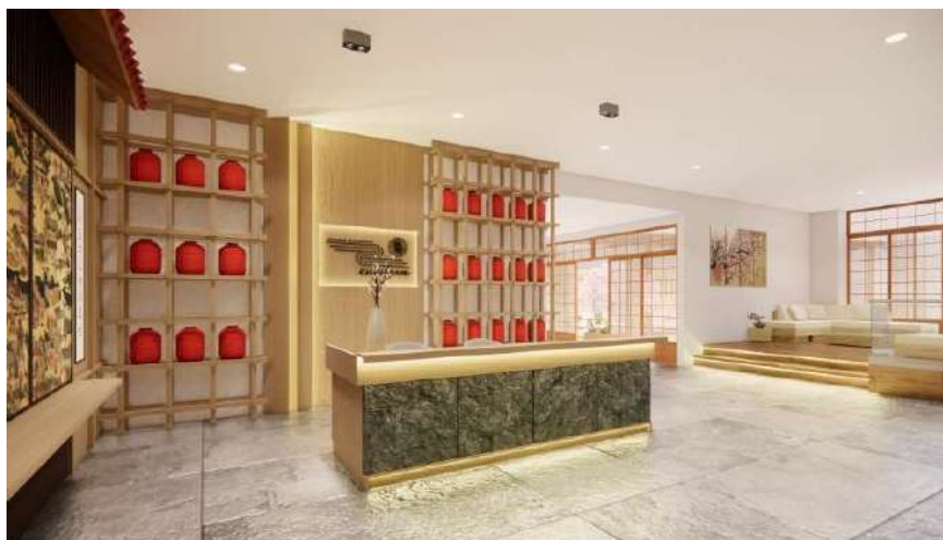
Gambar 10. Receptionist Restoran Kikugawa

Selanjutnya pengunjung akan melewati area memorabilia yang didesain menyerupai jembatan. Dibawahnya terdapat kolam yang merepresentasikan sungai. Hal tersebut terinspirasi dari desa Edo yang sering disebut/dikenal sebagai desa perikanan kecil. Selain itu, jembatan ini juga merupakan bentuk filosofi yang digunakan Kikugawa untuk menggambarkan peran restoran ini dalam menjembatani hubungan Indonesia dan Jepang.