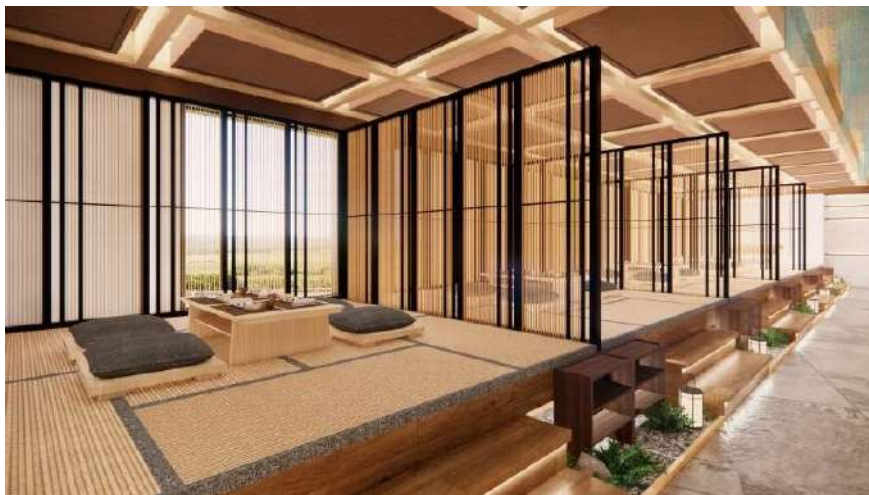
Gambar 14. Dining area (tatami) Restoran Kikugawa

Pada restoran ini memiliki banyak pilihan jenis area makan serta fasilitas yang ditawarkan. Jenis-jenis area makannya meliputi area makan regular, area makan tatami, area makan outdoor, hingga sushi bar . Berikut adalah area makan dengan jenis regular dan area makan tatami