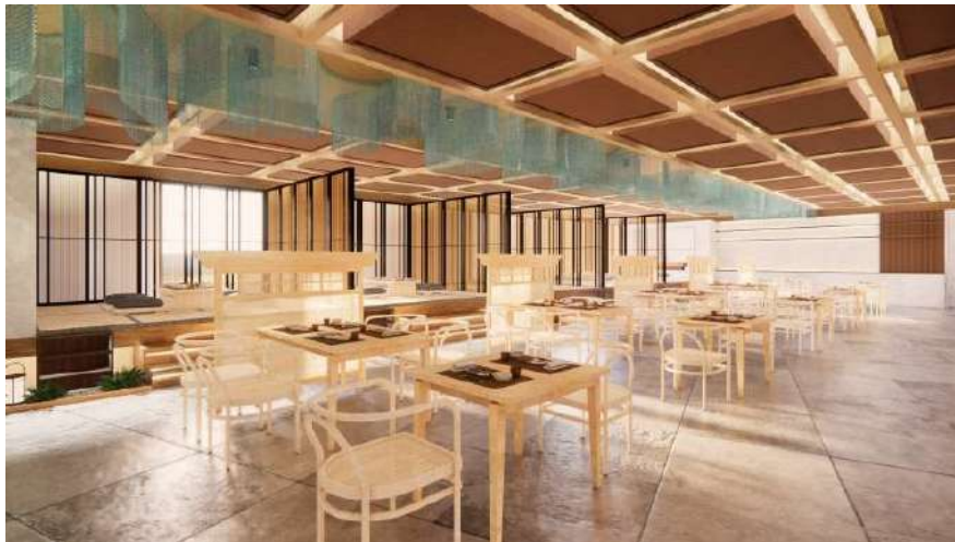
Gambar 13. Dining area (regular) Restoran Kikugawa

Pada restoran ini memiliki banyak pilihan jenis area makan serta fasilitas yang ditawarkan. Jenis-jenis area makannya meliputi area makan regular, area makan tatami, area makan outdoor, hingga sushi bar . Berikut adalah area makan dengan jenis regular dan area makan tatami