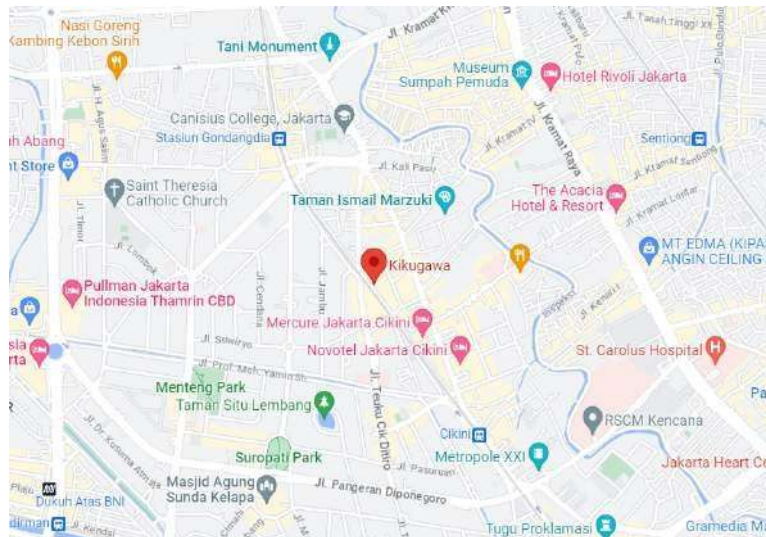
Gambar 1. Lokasi Restoran Kikugawa

Objek penelitian ini berlokasi di Jl. Cikini IV No.13, RW.5, Cikini, Kec. Menteng, Kota Jakarta Pusat, Daerah Khusus Ibukota Jakarta 10330.