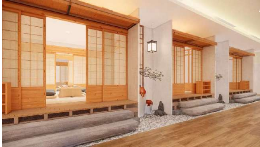
Gambar 11. Hallway private room Restoran Kikugawa

menciptakan keselarasan desain. Pada dinding belakang meja resepsionis digunakan kayu balok yang disusun seperti pagar dan dihiasi dengan lampion khas Jepang yang berwarna merah. Desain meja resepsionis terlihat cukup sederhana namun terdapat permainan material yaitu dengan menggabungkan kayu dan batu alam menciptakan desain yang dinamis dan menarik untuk dipandang.