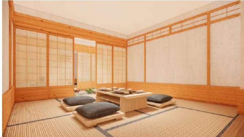
Gambar 12. Private room Restoran Kikugawa

Yang menjadi spesialisasi restoran ini adalah fasilitas private room dengan jenis tempat duduk tatami. Area ini tentu menawarkan pelayanan yang lebih eksklusif dari area makan lainnya. Mulai dari privasi pengunjung yang lebih terjaga hingga pelayanan yang lebih spesial.