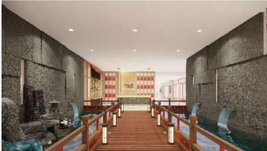
Gambar 9. Memorabilia Restoran Kikugawa

Ketika masuk, pengunjung akan langsung menjumpai area pertama dari restoran ini yaitu genkan. Genkan merupakan area transisi dari outdoor ke indoor , sehingga restoran ini memiliki area lobi yang difungsikan sebagai area transisi yang dihiasi oleh taman kering. Dari lobi hingga nantinya pengunjung menjumpai resepsionis, konsep desain yang dibawakan akan menggambarkan Tokyo zaman lampau dengan sebutan “Tokugawa”. Kayu adalah material yang sengaja ingin ditonjolkan pada area ini mulai dari penggunaan bahan kayu hingga finishing bermotif kayu. Bentuk dan desain panel dinding terinspirasi dari bentuk rumah-rumah di pedesaan Edo zaman lampau. Terdapat juga taman kering yang khas dengan rumah-rumah Jepang.