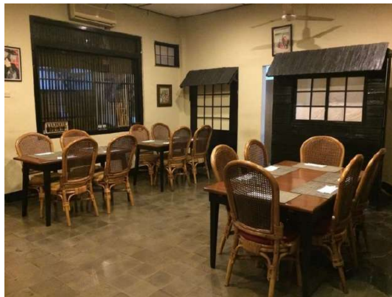
Gambar 4. Interior Restoran Kikugawa

Pintu masuk restoran ini menampilkan gaya Jepang kuno dengan atap khasnya.